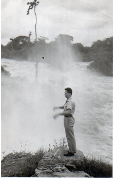
Au pied de la chute de la Sanaga