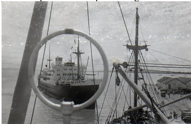
le cadre du goniometre (le paquebot

Théoriquement , pour tracer un relevement sur une carte marine ( qui est une projection de Mercator) et pour des grandes distances il faut appliquer la correction Givry , mais compte tenu de la précision générale de la mesure , on appliquait jamais cette correction.