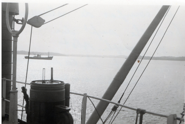
le cadre du gonio et le compas de relevement

Cette impulsion est émise par une base située sous la coque , dans un endroit peu perturbé par des turbulences de l'eau passant sous le navire . La coque est percée pour que la base d'émission soit au contact de l'eau . L'impulsion sonore est transmise a l'eau ^par l'intermédiaire d'un noyau métallique ; ce noyau est excité par une impulsion électrique suivant le principe de la magnéto-striction (le métal se dilate quand il est soumis à un champs magnétique).