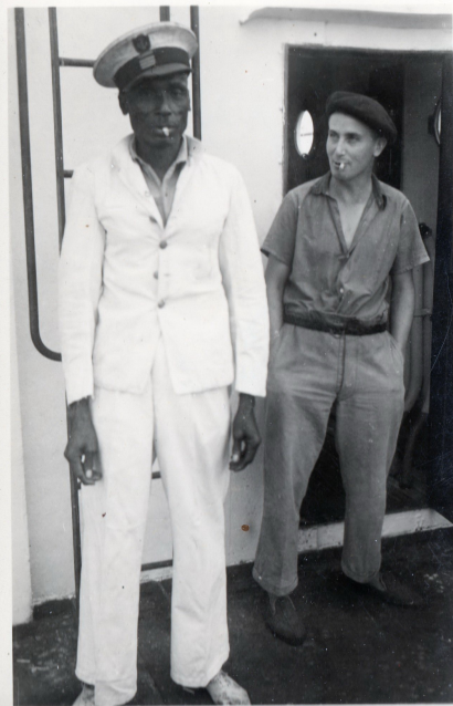
Le Chef Cacatois

Le chef Cacatois avait droit a une cabine ; cette faveur lui était attribuée surtout pour conforter son autorité vis-à-vis de ses hommes