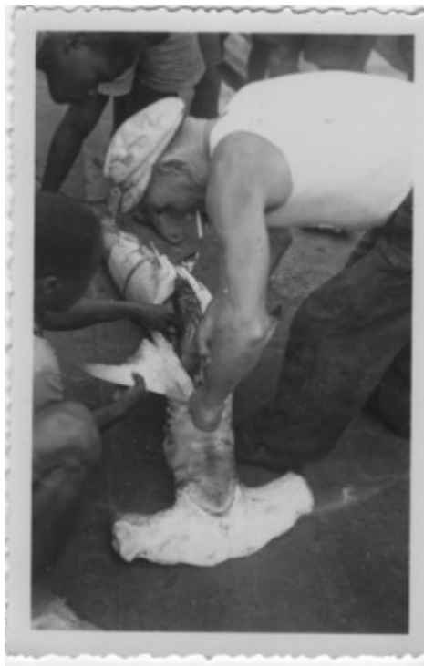
Le Bosco regarde dans l'estomac du requin marteau

Amenée sur le pont , la bestiole attira à nouveau tous les photographes amateurs et l'incident fut clos.