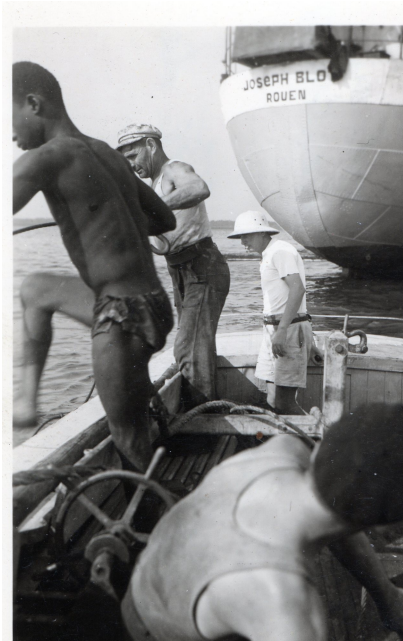
Un « mouillé » en pleine action

Toutes ces équipes étaient commandées par un Chef , le Chef Cacatois = en réalité c'était un chef tribal du village qui recrutait qui il voulait et qui empochait la quasi-totalité des salaires de ses hommes .