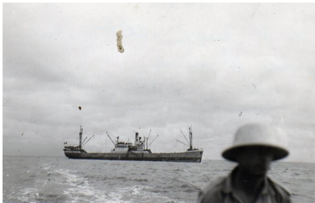
Le « Joseph Blot » sur rade

Pendant la traversée du golfe de Guinée , un événement atypique se produisit = le Commandant se dirigea sur un point mystérieux en pleine mer et fit stopper le navire ; il fit sortir une couronne de fleurs qu'il avait entreposée dans la chambre froide et la jeta à la mer. Il enleva sa casquette et se concentra sur une courte priere tout en faisant retentir la sirene du bord en guise de salut : il expliqua que son frere était décédé la en 1942 , son navire ayant été torpillé par un U-Boat entraînant la totalité de l'équipage dans la mort. Apres ce recueillement de courte durée , il remit sa casquette et sans autre commentaire manoeuvra le chadburn sur « en avant toute » ----- cette petite cérémonie était simple mais tres émouvante et nous quittames ce lieu – cimetiére en pensant aux innombrables marins qui perirent dans les memes conditions.