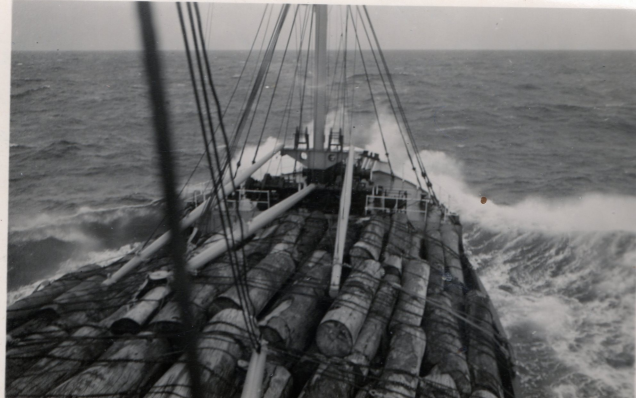
»Joseph Blot » dans les alizés

Après avoir quitté les quais de Rouen , on descendit la Seine vers la haute mer et on remit les deux Sénégalais au travail sur le pont ou ils travaillaient avec le reste de l'équipage : c'était sans compter pour leur détermination à rester en France . A hauteur de La Mailleraye , après s'être concerté ,l'un sauta à l'eau sur tribord et l'autre sur babord et ils partirent à la nage vers la berge . J'envoyais un message à la capitainerie du port de Rouen pour signaler les faits . Nous apprimes plus tard que les gendarmes avaient arrêté l'un d' eux mais que l'autre était resté introuvable : et pour cause , il s'était noyé et son cadavre remonta à la surface des semaines plus tard.