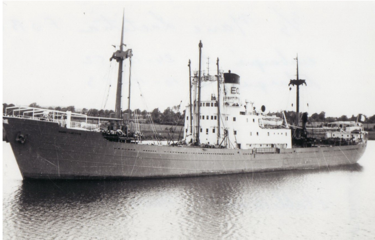
Le S/S Marie Laetitia

Soudain le gisement du radiogoniometre m'indiqua 10° sur babord , puis quelques minutes plus tard 20° : on était en train de se croiser sans se voir ! toutes les jumelles étaient braquées vers l'avant alors qu'il était sur babord ! je demandai a mon collegue de passer en téléphonie et les deux Commandants organiserent leur rencontre .....ouf , il était moins de deux qu'on se ratait dans la brumasse du pot au noir !