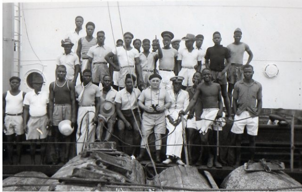
Le Commandant avec les Kroumen